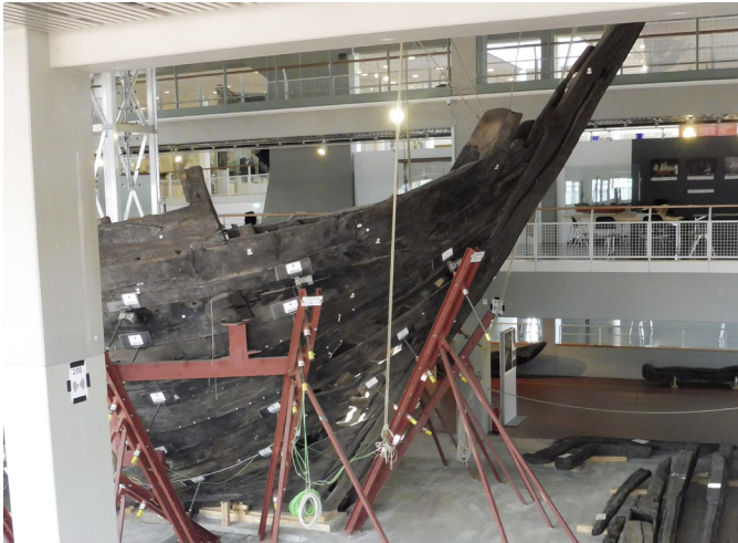
Abbildung 3: Die Bremer ‚Kogge‘, Deutsches Schiffahrtsmuseum

entbrannte ein Konflikt um die Beherbergung des Schiffes, für die mehrere Standorte diskutiert wurden, bis sich schließlich der Plan eines Schiffahrtsmuseums in Bremerhaven durchsetzte (Fliedner 2003). Der Rohbau wurde durch eine Bootshalle erweitert. In ihr konnten die Besucher den jahrelangen Aufbau und schließlich die jahrzehntelange Konservierung des mittelalterlichen Wracks miterleben. Dieser Konservierungsprozess ist immer noch nicht abgeschlossen und wird als Forschungsprozess in der künftigen Ausstellung thematisiert werden.