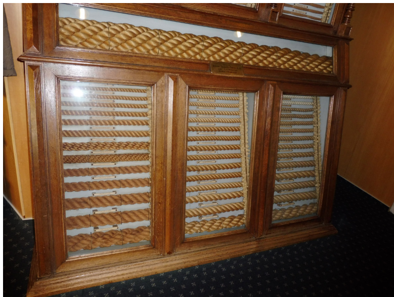
Abbildung 2: Tauwerkproben, Deutsches Schifffahrtsmuseum

eines umwälzenden Strukturwandels in maritimen Berufen und Küstenregionen (Ludwig, Wolnik, Tholen 2014). Diese emotionale Nähe drückt sich auch in der Beteiligung der Laien aus: Schifffahrtsmuseen sind häufig sehr eng mit ehrenamtlicher Mitarbeit und mitgliederreichen Fördervereinen verbunden. Der Förderverein des Deutschen Schifffahrtsmuseums beispielsweise gilt als der größte Museumsförderverein in Deutschland. 2